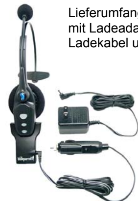
Lieferumfang komplett mit Ladeadapter, KFZ-Ladekabel und Netzteil.